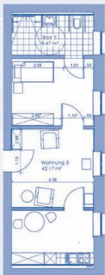
Grundriss eines der Appartements

Unser Konzept für „Betreutes Wohnen“ bietet Ihnen neben Betreuungs- auch verschiedene Serviceleistungen an, die Sie ganz nach Bedarf zu Ihrer Unterstützung wählen können. Durch die Anbindung der Appartements an das St. Josefshaus bieten sich für die Mieter/innen vielfältige Chancen: Sie haben unter anderem die Möglichkeit zur Teilnahme an hausinternen Veranstaltungen und Feierlichkeiten, zu Besuchen in der Klosterkirche, zu